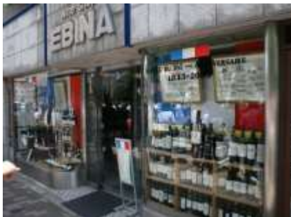
Lettre 23 (oct. nov. 2016)

Magasins de vins français à Kyoto et de saké à Paris