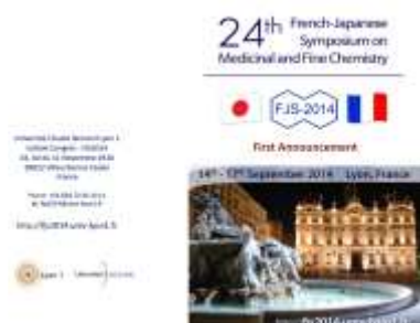
Lettre 19 (janv. 2016)