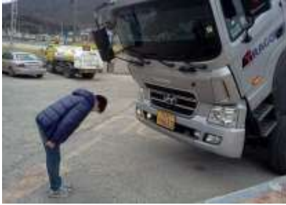
Lettre 49 (avril-mai 2022)