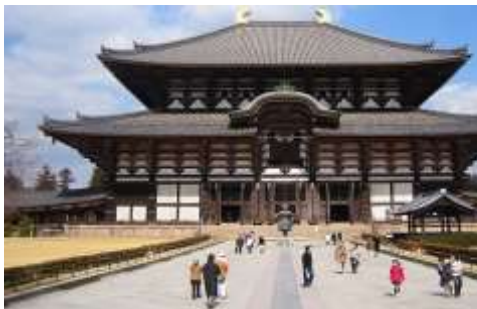
Lettre 39 (mai-juin 2019)