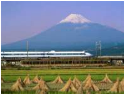
Lettre 10 (nov. 2013)

Images symboles des 2 pays : Fuji et Mont St Michel