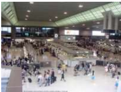
Lettre 31 (janv. 2018)

Aéroports Narita et Ch. De Gaulle : lequel est lequel ?