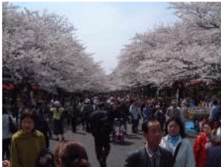
Lettre 2 (mai 2012)

Printemps (cerisiers en fleurs) à Paris et Tokyo