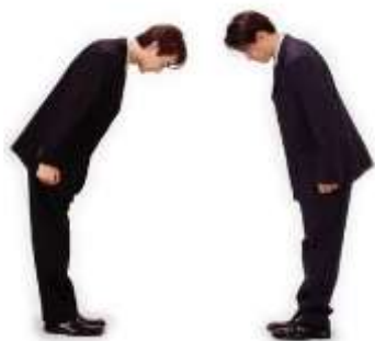
Lettre 17 (juin 2015)