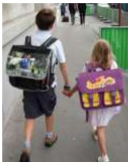
Lettre 4 (septembre 2012)