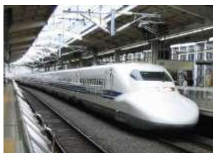
Lettre 18 (oct. 2015)