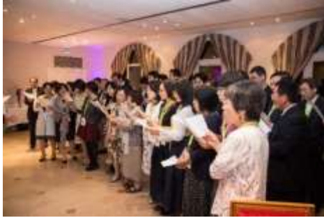
Lettre 29 (oct. 2017)

Les chœurs japonais et français lors d'un symposium FJS