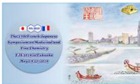
Lettre 36 (dec. 2018)