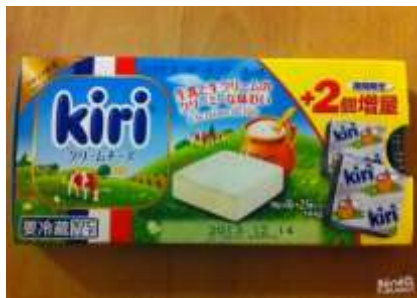
Lettre 35 (oct. nov. 2018)