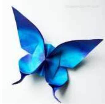
Lettre 25 (mars 2017)