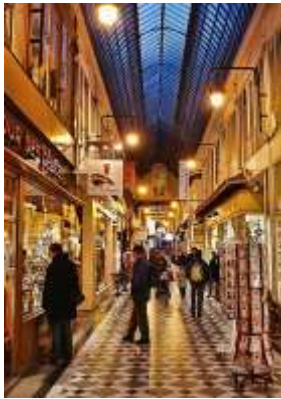
Lettre 33 (mai-juin 2018)

Passage couvert parisien et marché de Kyoto