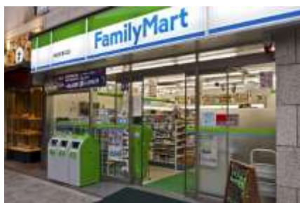
Lettre 48 (sept.-oct. 2021)