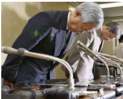
Lettre 24 (janv. 2017)