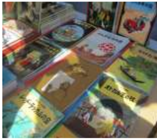
Lettre 7 (mai 2013)

Tintin en japonais ou manga en français ?