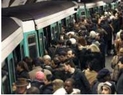
Lettre 9 (oct. 2013)

Affluence dans les métros parisien et tokyoïte