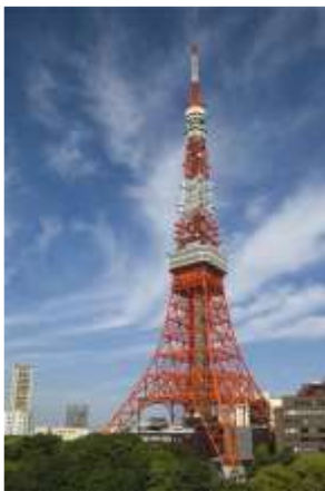
Lettre 8 (juin-juil. 2013)