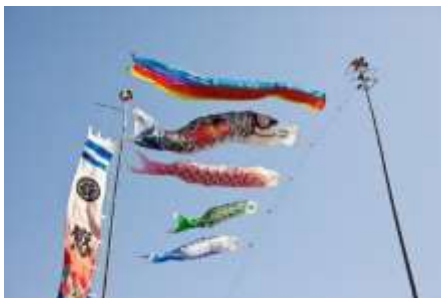
Lettre 27 (mai 2017)

Symboles du mois de mai dans nos deux pays