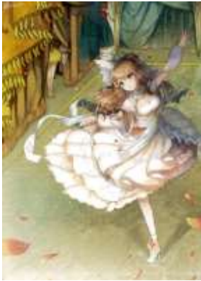
Lettre 41 (oct. 2019)