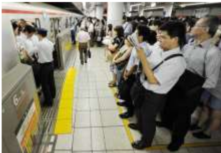
Lettre 15 (fev. -mars 2015)