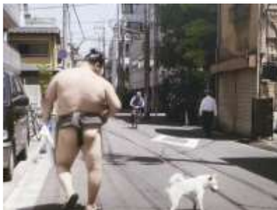
Lettre 11 (mai 2014)