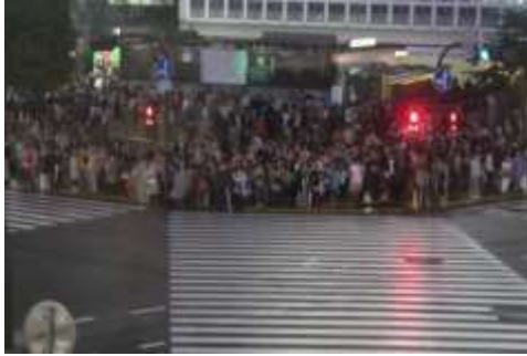
Lettre 37 (janv. 2019)