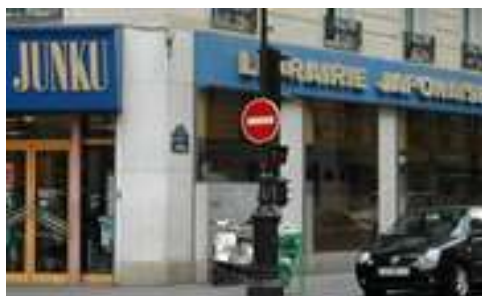
Lettre 47 (juin-juil. 2021)

Librairie Junku à Paris et librairie Omeisha à Tokyo