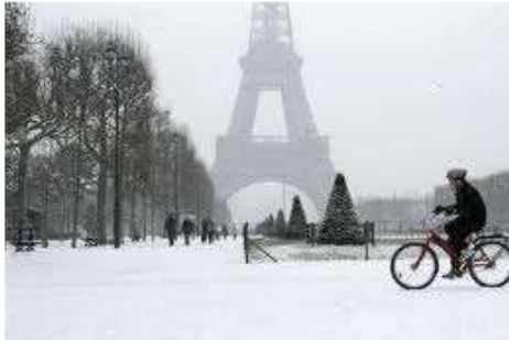
Lettre 1 (janvier 2012)