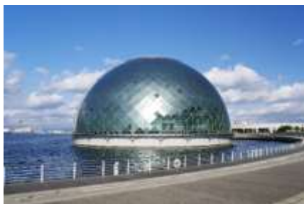
Lettre 32 (mars-avril 2018)

Architecture française au Japon (Osaka), japonaise en France (Metz)