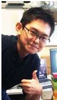
Lettre 26 (avril 2017)

Etudiants japonais en France et français au Japon