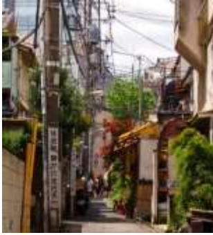
Lettre 21 (juin 2016)

Similitudes : petites rues tranquilles à Tokyo et dans le sud de la France