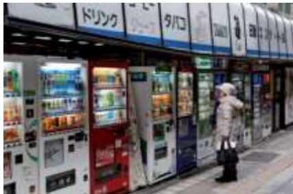
Lettre 43 (dec. 2019)