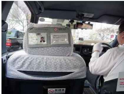
Lettre 45 (mars-avril 2020)