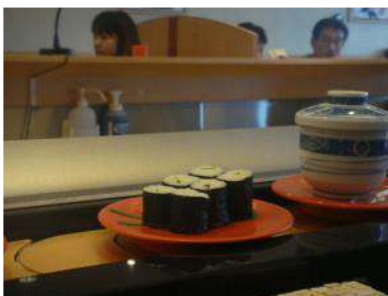
Lettre 16 (avril-mai 2015)