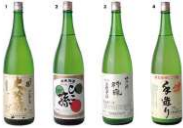
Lettre 5 (nov.-dec. 2012) Saké vs vin