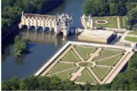
Lettre 13 (sept. 2014)

Merveilles de l'architecture des deux pays