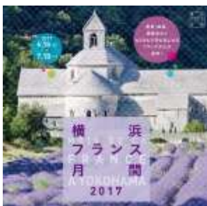
Lettre 28 (juin 2017)