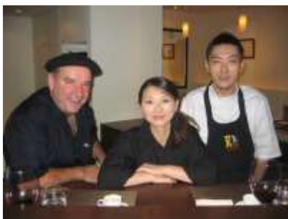
Lettre 12 (juin-juil. 2014)