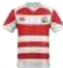
Lettre 40 (sept. 2019)

Coupe du monde de rugby 2019 : les maillots et emblèmes des 2 équipes