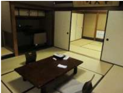
Lettre 14 (oct. 2014)