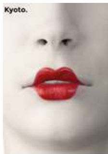
Lettre 38 (mars-avril. 2019)