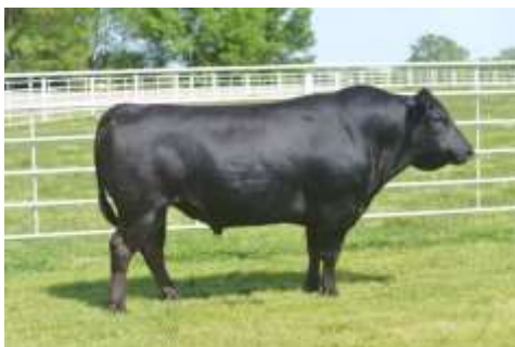
Lettre 44 (janv. 2020)

Les deux sont très célèbres : Kobe et limousin