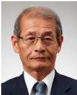
Lettre 42 (nov. 2019)