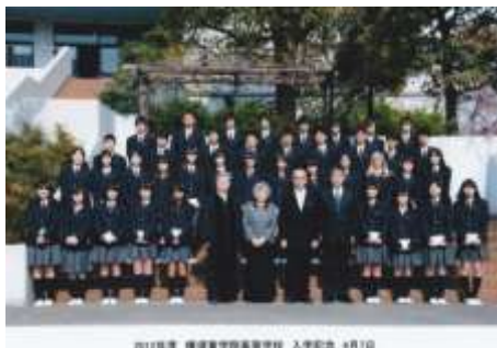
Lettre 34 (sept. 2018)