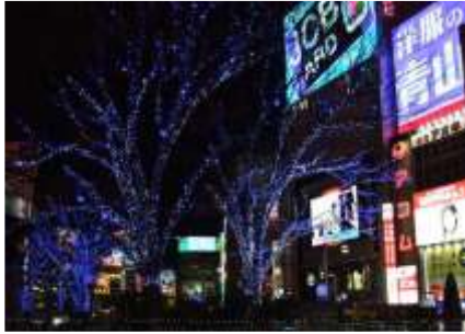
Lettre 6 (dec. 2012)