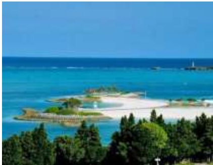
Lettre 22 (sept. 2016)

Similitudes : Plages d'Okinawa et de la Côte d'Azur