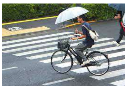
Lettre 20 (mars 2016)