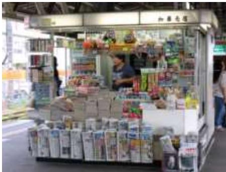
Lettre 30 (nov. 2017)

Kiosques dans les rues japonaises et françaises