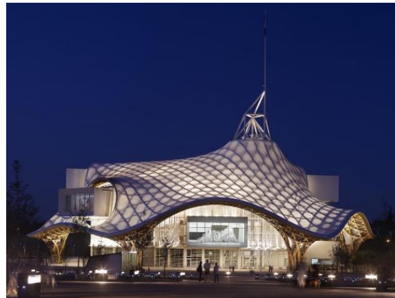
Shigeru Ban : le Centre Pompidou de Metz