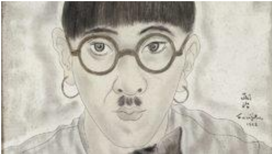
Autoportrait du plus français des peintres japonais. Son œuvre relie les cultures et les techniques des deux pays.

Au Musée Maillol à Paris (59-61 rue de Grenelle, Paris 7 ème ) à partir du 7 mars et jusqu'au 15 juillet se tient une exposition des œuvres du peintre Foujita à l'occasion du 50 ème anniversaire de sa disparition.