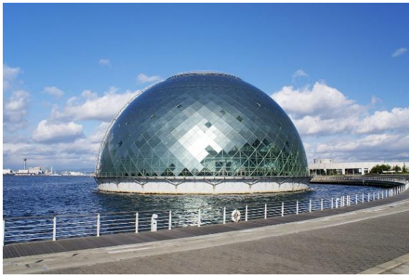
Paul Andreu : le musée maritime à Osaka

Dans ce numéro une touche d'architecture avec les photos ci-dessous de deux bâtiments célèbres (voir aussi page 3) et l'annonce de l'exposition Foujita